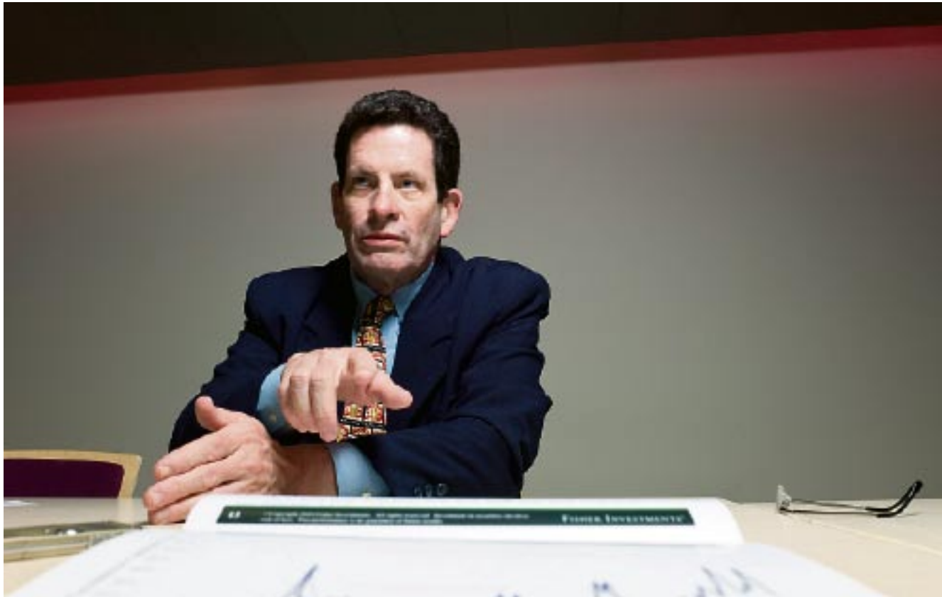
Ken Fisher: «Rohstoffe, Industrie, Technologie, zyklische Konsumgüter und Energie werden 2011 an den Börsen gut abschneiden.»

Die unfassbare Tragödie in Japan ist wirtschaftlich gesehen kein Desaster, sie ist eine Chance. Naturkatastrophen und solche, die von Menschenhand gemacht werden, haben uns leider immer schon begleitet. Die Spanische Grippe im Jahr 1918 – eine riesige, hässliche, echte Katastrophe, aber auch eine Riesenchance. Danach sind die Aktienkurse durch die Decke gegangen. Tschernobyl 1986? Eine Chance! Die Aktien stiegen im selben Jahr weltweit gewaltig. Japan ist gross und wichtig. Seine Aktienmärkte haben jetzt schwer gelitten. Anleger sollten diese Situation nutzen. Die Welt geht nicht unter, Japan wird es auch nicht tun.