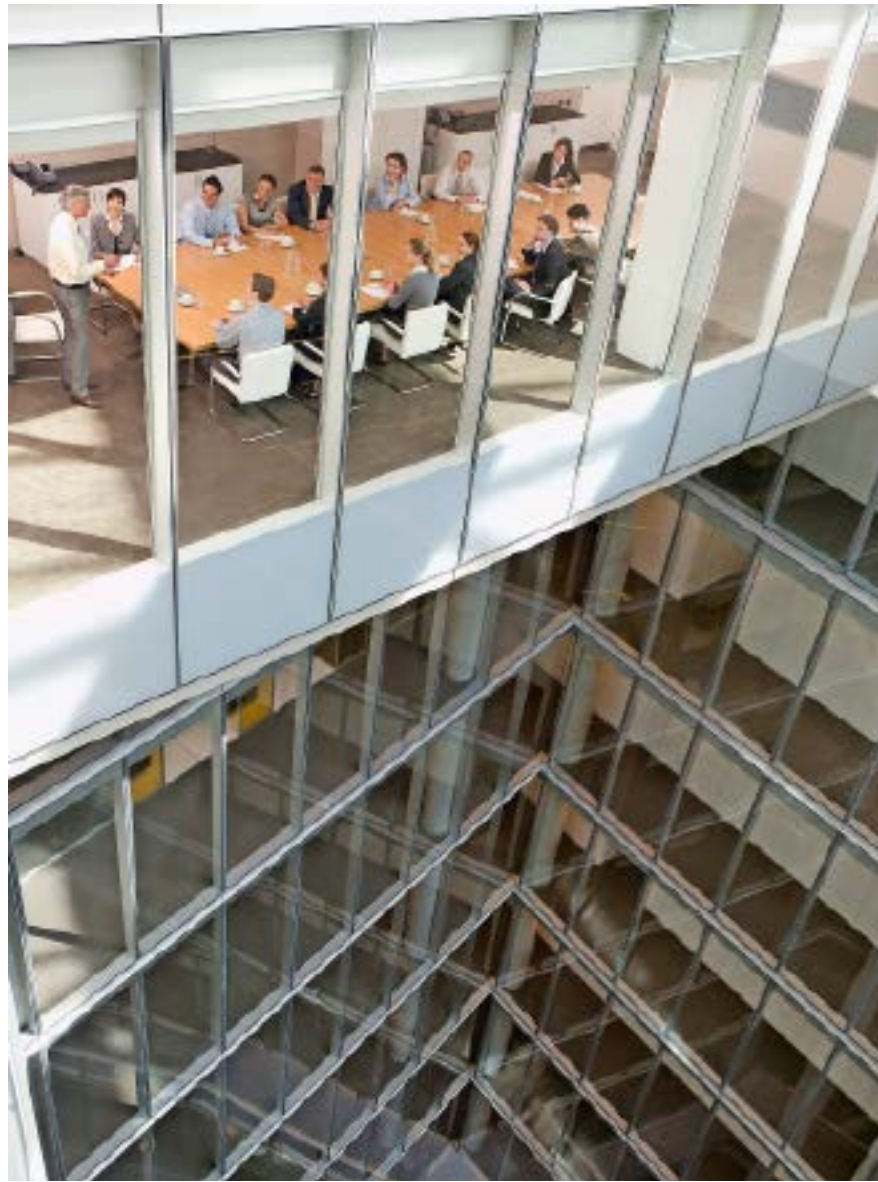
In 45 der 205 SPI-Unternehmen sitzt der CEO auch im Verwaltungsrat.

Situationen, in denen die Kombination von CEO- und VR-Funktion im gleichen Unternehmen vertretbar ist, nennt zRating-Leiter Volonté. Er erwähnt den Fall