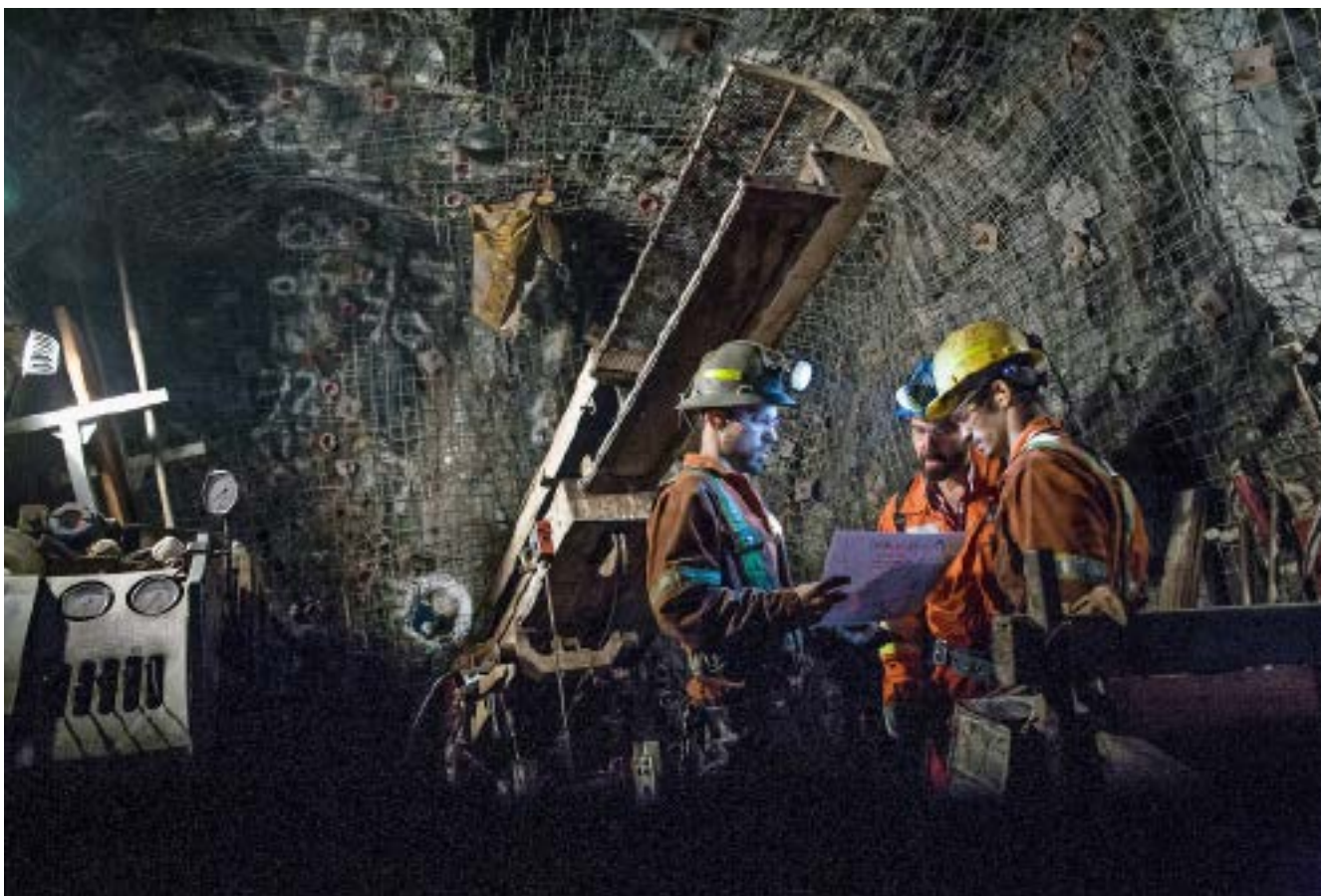
Zinkmine in Quebec: Bergbau ist eine gefährliche und schmutzige Angelegenheit. Glencore versucht dem entgegenzuwirken.

Gemäss dem aktuellen Nachhaltigkeitsbericht hat Glencore 2017 in drei Bereichen die Ziele erreicht: Es gab keine bedeutenden oder katastrophalen Umweltereignisse, die berufsbedingten Krankheitsfälle konnten stark reduziert werden, und es kam zu keinen schwerwiegenden Menschenrechtsverletzungen. In einem Bereich wurde das Ziel verfehlt: An Glen-